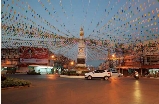
新市街中心地の時計塔