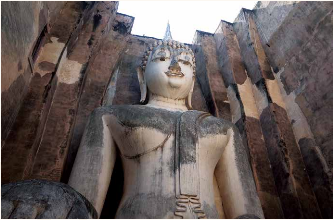
ワット・シー・チュムのアチャナ仏