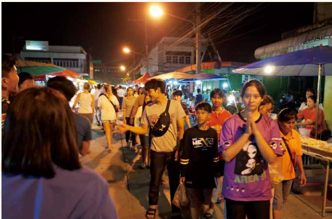
ナイトマーケット

首都バンコクの北側約440kmに位置するスコートイは、日本でも有名なアユタヤ文明が生まれる前に栄えたタイ族最初の文明の地です。タイ語で「幸福の夜明け」を意味する同地は今から約900年前に誕生。140年と短いながらも輝かしい繁栄を誇りました。仏教遺跡が良好な状態で保存されており、各遺跡群を自転車で回ることが可能です。遺跡群は1991年にユネスコの世界遺産にも登録をされており、アユタヤ文明の仏教遺跡や隣国のカンボジア・アンコールワットとは一味違うスコートイ美術様式を味わうことができます。中でも、ワット・シー・チュムのアチャナ仏は圧巻です。新市街では夜にナイトマーケットが催されており、タイの地方都市ならではのほのぼのとした空気も楽しむことが可能です。バンコクから飛行機で1時間程度でアクセスが可能ですので、ちょっとした気分転換をするための旅行地としてお勧めです。